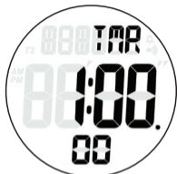
MODE COMPTE À REBOURS